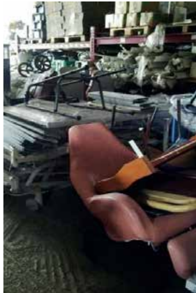
One of the wheelchairs offered to the disabled