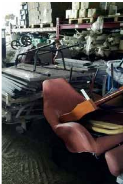
Une des chaises offerte aux handicapés